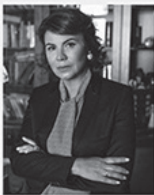
Заслужений юрист України

Хочеш побудувати політичну кар'єру, змінити свою країну та стати лідером у своїй сфері? Тоді Key Generation - це саме для тебе!